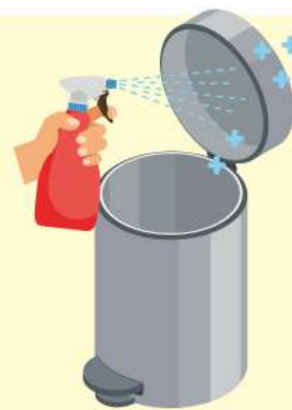
기구 등의 살균소독제로 살균 소독하기

쓰레기통 내·외부는 세척제로 씻어 행굼 후, '기구 등의 살균소독제'를 활용하여 살균 소독해야함