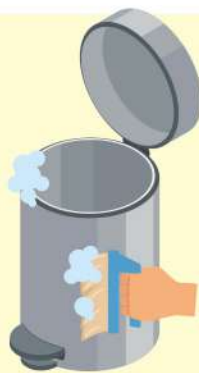
세척제로 통과 뚜껑의 내·외부를 세척