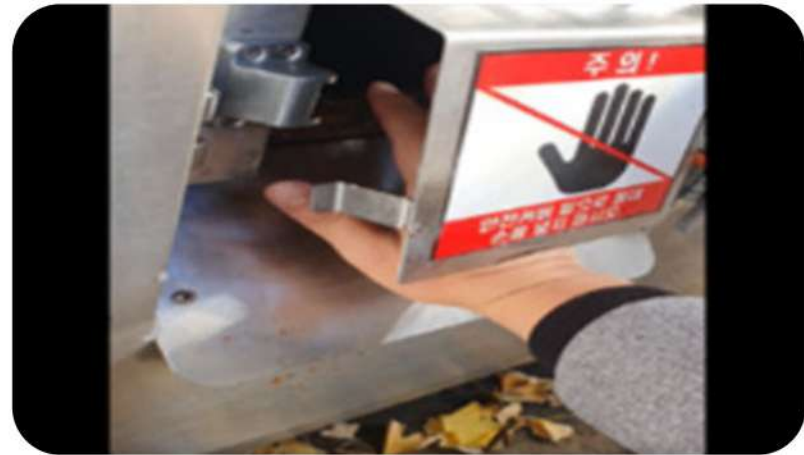
음식물 감량기 배출구의 날카로운 부분에 절단, 베임 사고 주의