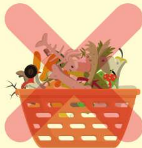
음식물 쓰레기의 비위생적인 보관 금지