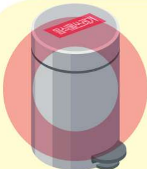
음식물 전용 쓰레기통