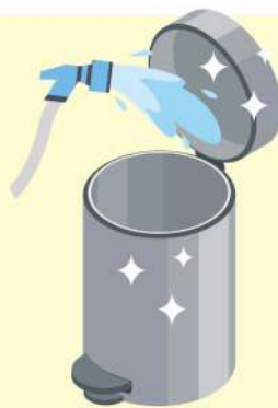
물 행굼 뒤 뒤집어서 건조