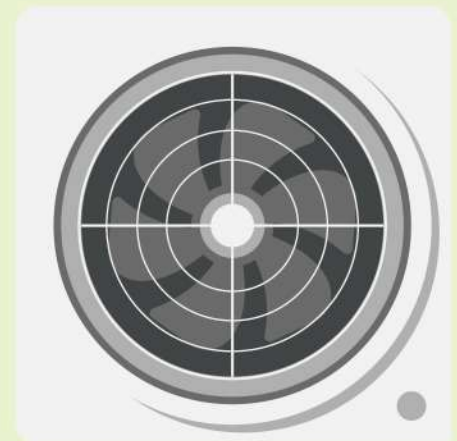
개폐장치가 있는 환풍기 설치