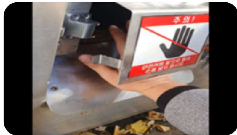
음식물 감량기 배출구의 날카로운 부분에 절단, 베임 사고 주의